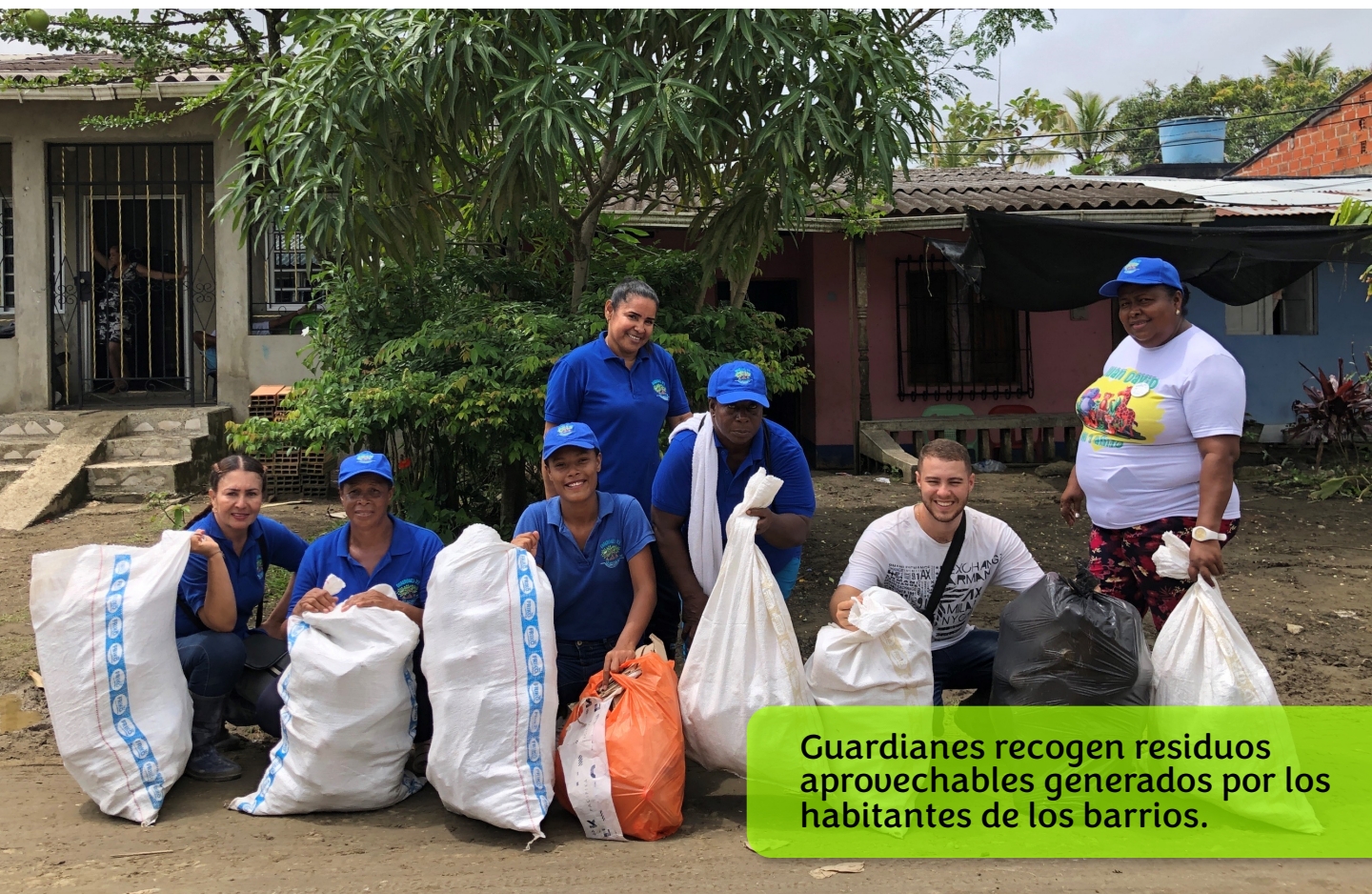
Guardianes recogen residuos aprovechables generados por los habitantes de los barrios.