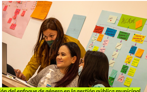
Entrenamiento sobre la transversalización del enfoque de género en la gestión pública municipal