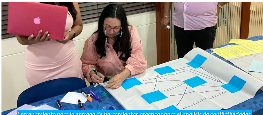
Entrenamiento para la entrega de herramientas prácticas para el análisis de conflictividades sociales en el nivel municipal.